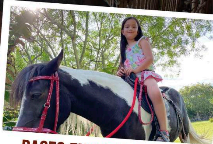
PASEO EN PONY: $13.000