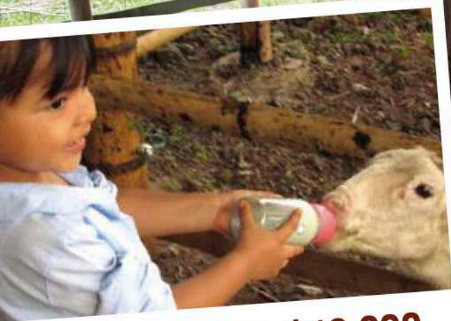
KIT DE GRANJA: $13.000