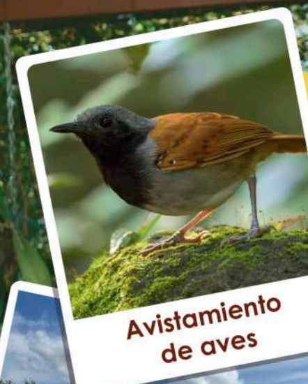
Avistamiento de aves