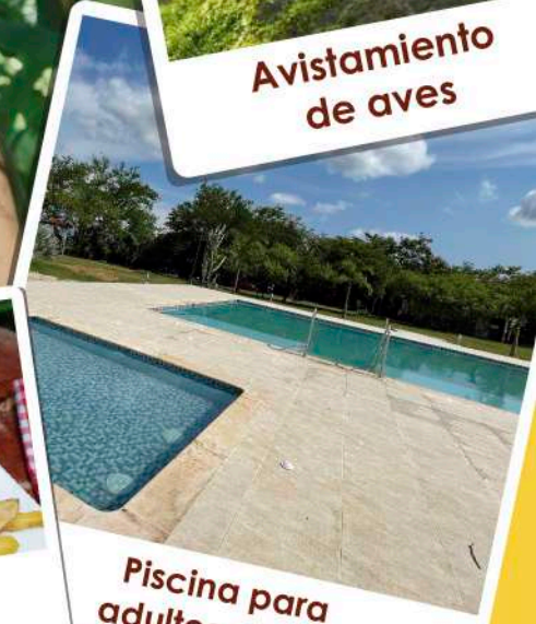
Piscina para adultos y niños